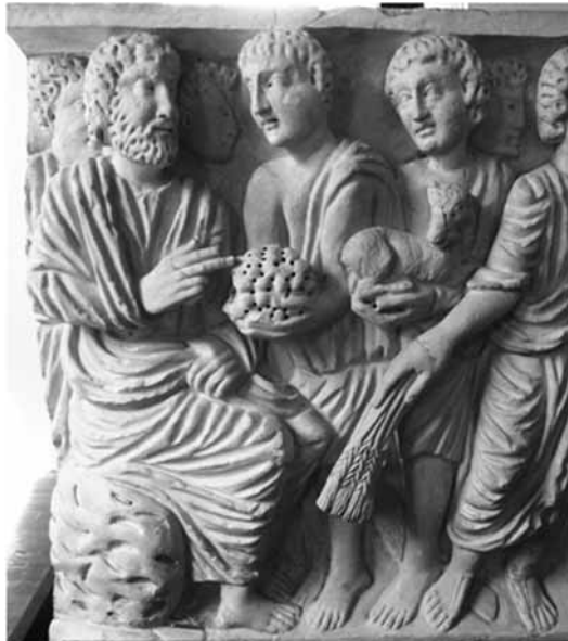
2. ábra: 4. századi ókeresztény szarkofág részlete, Vat. Inv. 31556.3.1 Museo Pio Cristiano.

„Szükséges tehát, hogy áldozatot mutassunk be Istennek, és minden körülmény közepette hálásnak találtassunk a Teremtő Isten iránt, tiszta gondolkozással, képmutatás nélküli hittel, szilárd reménységgel, izzó szeretettel hozva elé teremtményeinek első zsengejét. Ezt az áldozatot pedig egyedül az egyház mutatja be tisztán a Teremtőnek, hálaadással áldozva teremtményeiből. A zsidók viszont már nem mutatnak be áldozatot, mivel kezük vérrel van rakva; mert nem fogadták be az Igét, aki által áldozatot lehet bemutatni Istennek. De az eretnekek egyetlen gyülekezete sem [mutat be áldozatot]. Egyesek ugyanis miközben a Teremtőn kívül másik Atyáról beszélnek, ebből az ál-