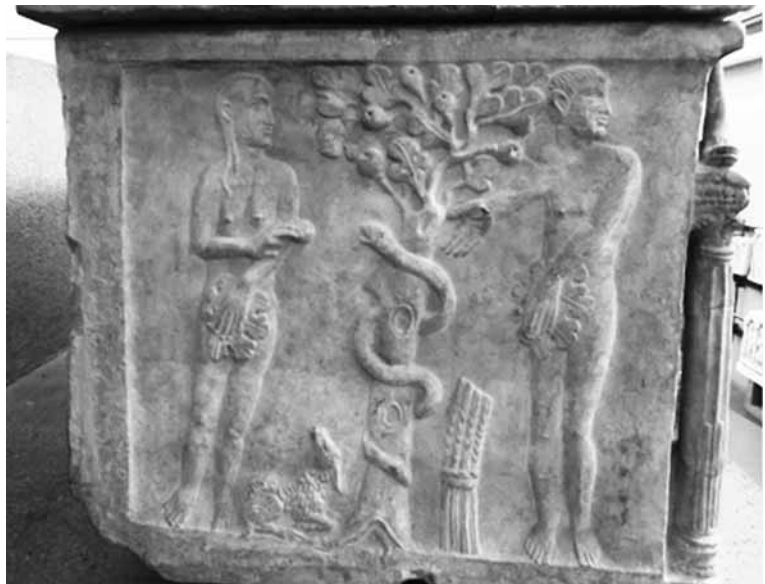
3. ábra: Agape és Crescentianus szarkofágja AD 330–360 Vat. Inv. 31490. Museo Pio Cristiano.

Egyes ókeresztény szarkofágokon a bűnbeesés jelenetét úgy ábrázolták, hogy Ádám kezében egy köteg búzakalász van, míg Éva egy bárányt tart. Irenaeus teológiája mély értelmet kölcsönöz e jeleneteknek: a kezdet magában foglalja véget. A búzakalász és a bárány már a kezdet kezdetén a megtestesült Jézus Krisztusra utal, aki testben eljön, hogy magához hívja a bűnösöket, és húsvéti bárányként áldozatul adja magát, hogy akik magukhoz veszik az ő testét és véréjét, azoknak örök élete legyen.