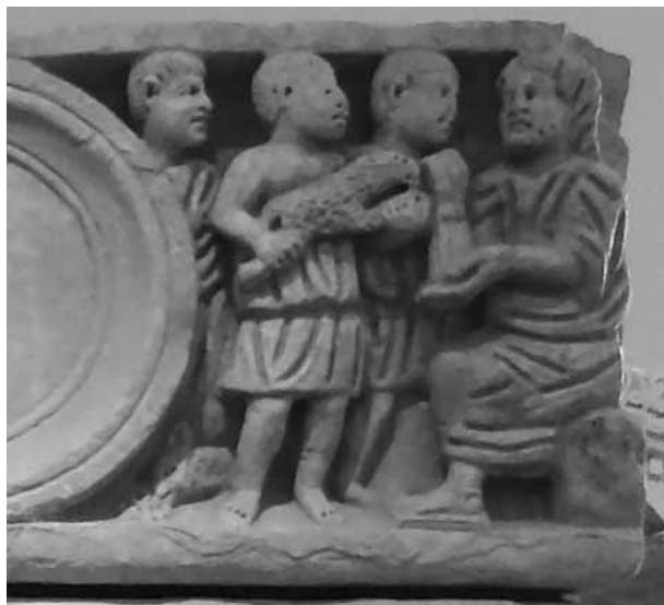
1. ábra: Káin és Ábel áldozatot mutat be az Úrnak. Ókeresztény szarkofág részlete, 4. század első fele, Arles.

Talán éppen erre az Istennek tetsző, tiszta áldozatra utal 4. századi ókeresztény szarkofágokon az a jelenet, amikor Káin búzakalászt vagy kenyeret, Ábel bárányt ajánl fel egy trónon ülő alaknak, akit véleményem szerint az örök Igével — és nem az Atya Istennel! — azonosíthatunk.