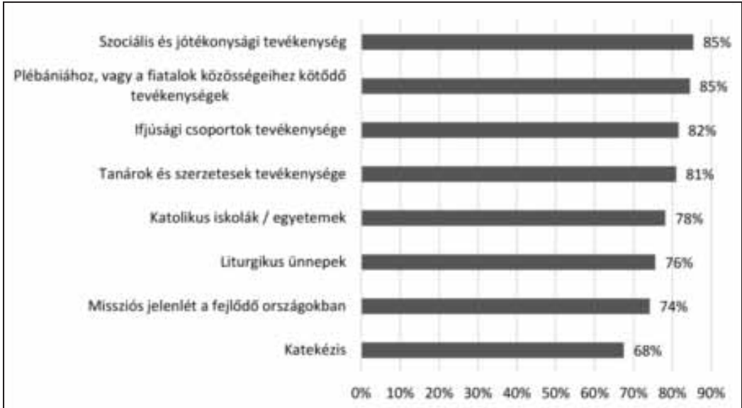
2. ábra: Mennyire tartod fontosnak a katolikus egyház itt felsorolt tevékenységeit? (öt fokú skála, a „nagyon nagymértékben”, illetve „jelentősen” választ adók együttes aránya)