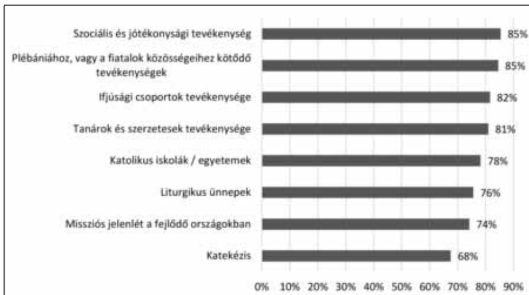
2. ábra: Mennyire tartod fontosnak a katolikus egyház itt felsorolt tevékenységeit? (öt fokú skála, a „nagyon nagymértékben”, illetve „jelentősen” választ adók együttes aránya)